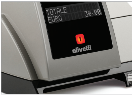
Display cliente integrato di tipo alfanumerico, retroilluminato