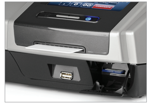
Giornale di fondo elettronico, USB master e lettore chip card integrato