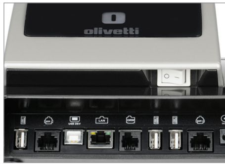
Ampia disponibilità di connessioni seriali, USB e Ethernet